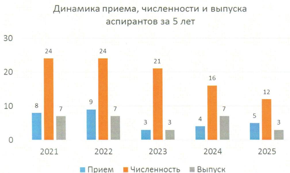
Рисунок 2 – Динамика приема, численности и выпуска из аспирантуры за пятилетний период

Динамика приема, численности и выпуска из аспирантуры за период с 2021 по 2025 годы приведена на рисунке 2.